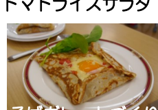
そばガレットづくり