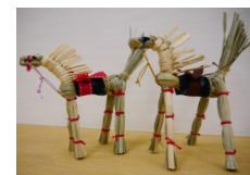
すげ細工 春駒づくり