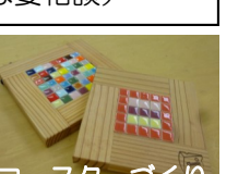
コースターづくり