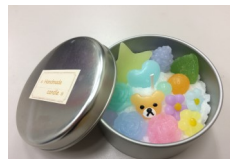
ハコニワ キャンドル