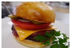
ハンバーガづくり