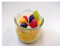
デコレーション キャンドル