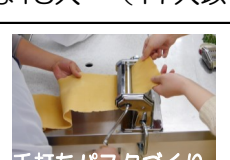
手打ちパスタづくり